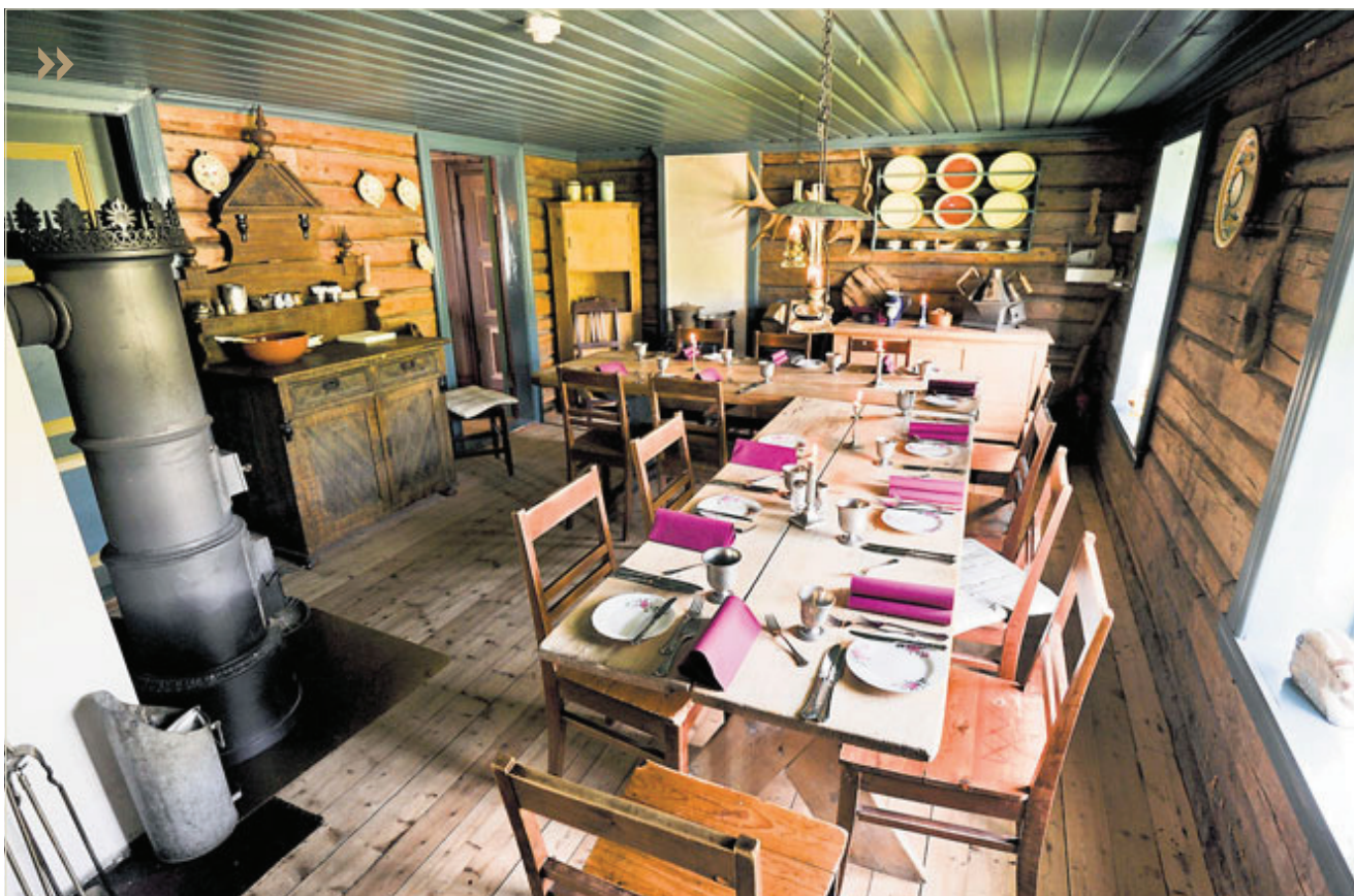
SPISESALEN. I 2. etasje kan det dekkes til 44. Her spiser man i lyset av midnattssol. Eller parafinlamper på høst og vinter.