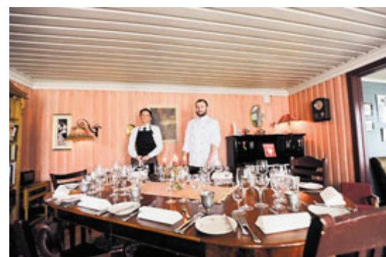
INTIMT. Skagen Gaard har tre vakre stuer, og i denne er det dekket opp til ti personer som ankommer gården med seilbåt.